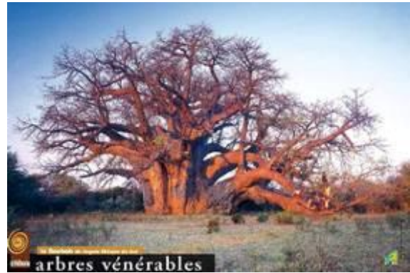
Baobab ( Adansonia digitata ) – Sagole – Limpopo – Afrique du Sud