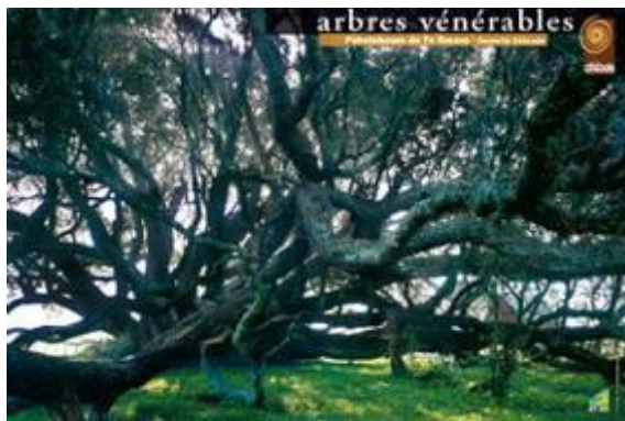
Pohutukawa ( Metrosideros excelsa ) – Te Araroa – Coromandel – Nouvelle Zélande