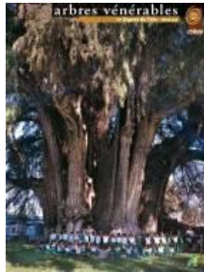
Cyprès de Tule - Mexique