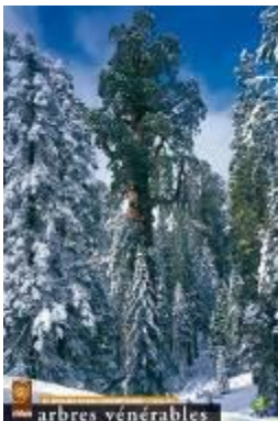
Sequoia géant "General Grant" - USA