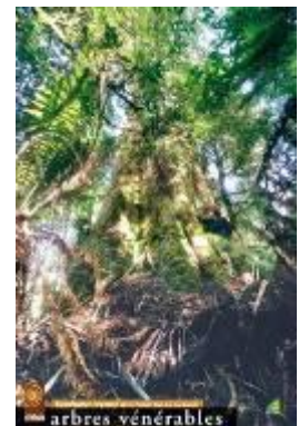
Eucalyptus regnans - Forêt pluviale - Tasmanie