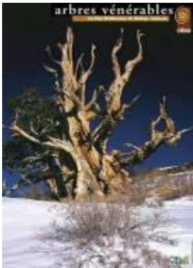
Pin de Bristlecone - Californie - Etats Unis