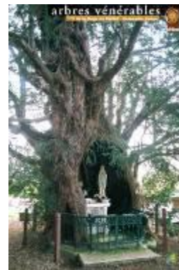
If de la Haye de Routot - Normandie - France