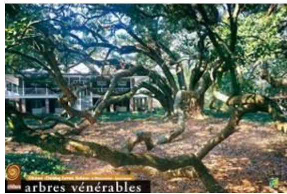
Chêne de vie ( Quercus virginiana ) – « Dobby Seven Sister » - Louisiane – Etats Unis