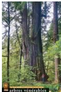
Thuja plicata « Cheewhat lake » - BC - Canada