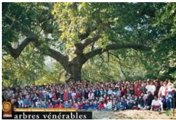
Platane de Lamanon – Bouches du Rhône – France