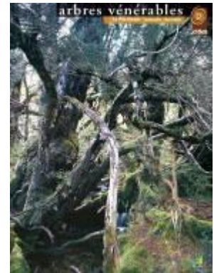
Pin Huon de Tasmanie - Australie